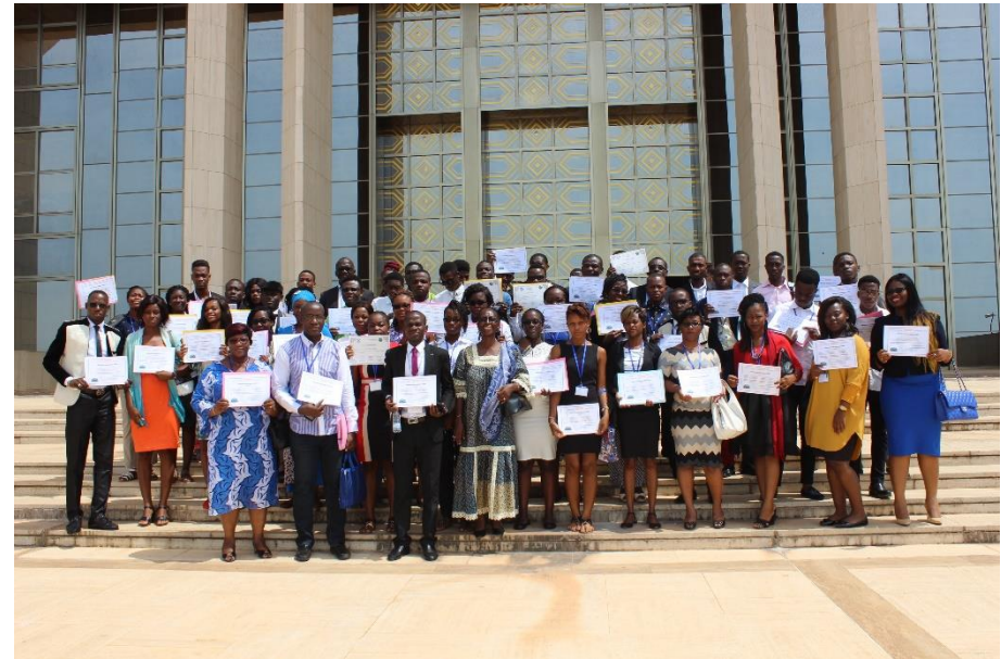
La photo de famille sur le parvis de la Fondation FHB