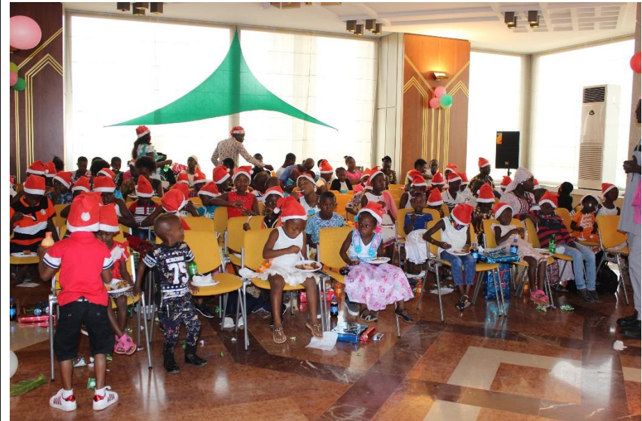
Les enfants heureux d'avoir reçu leurs cadeaux