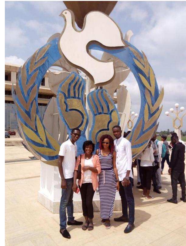
des participants au séminaire sur le parvis de la Fondation FHB