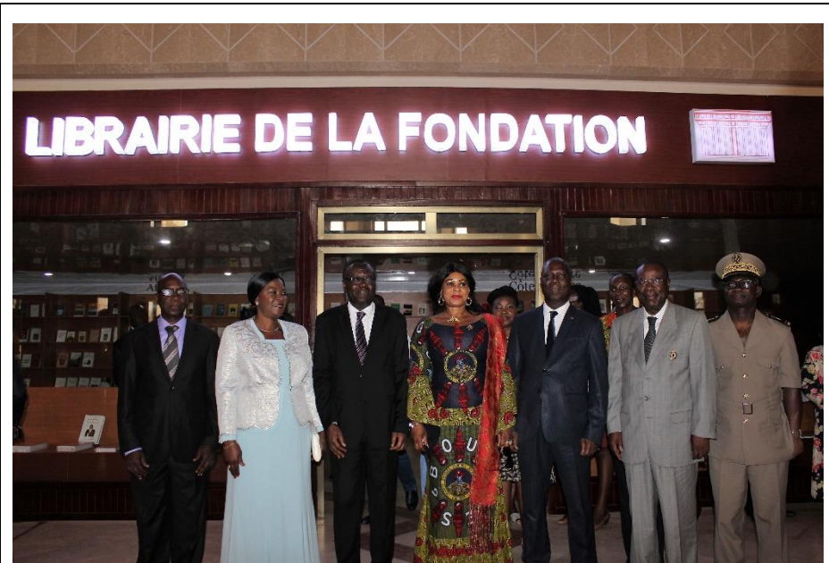
La photo de famille à l'entrée de la Librairie de la Fondation