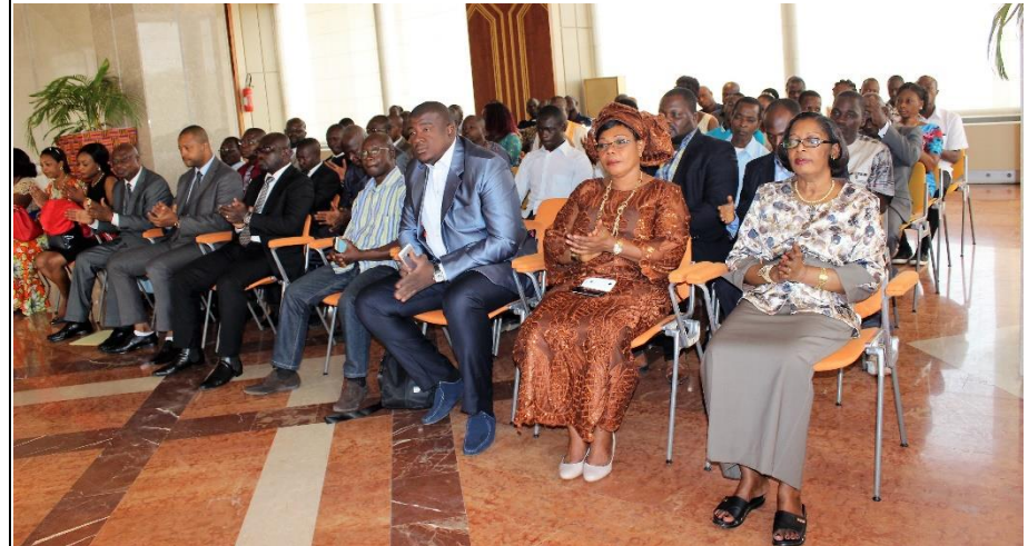
Le personnel de la Fondation FHB