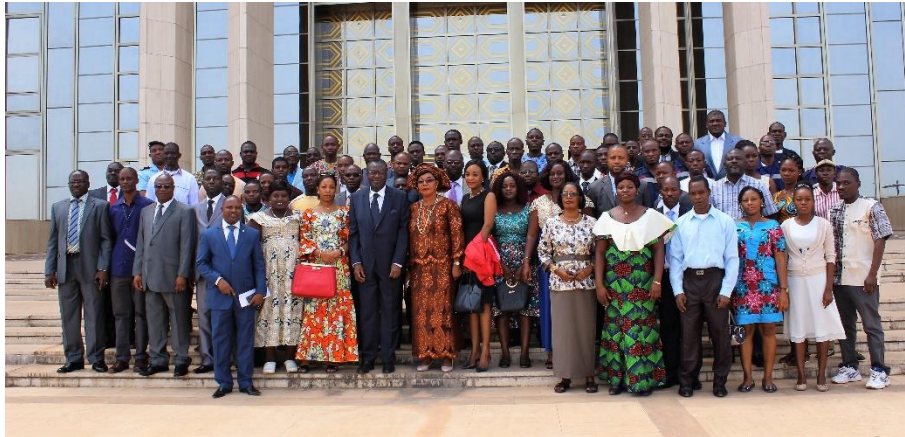
La photo de famille