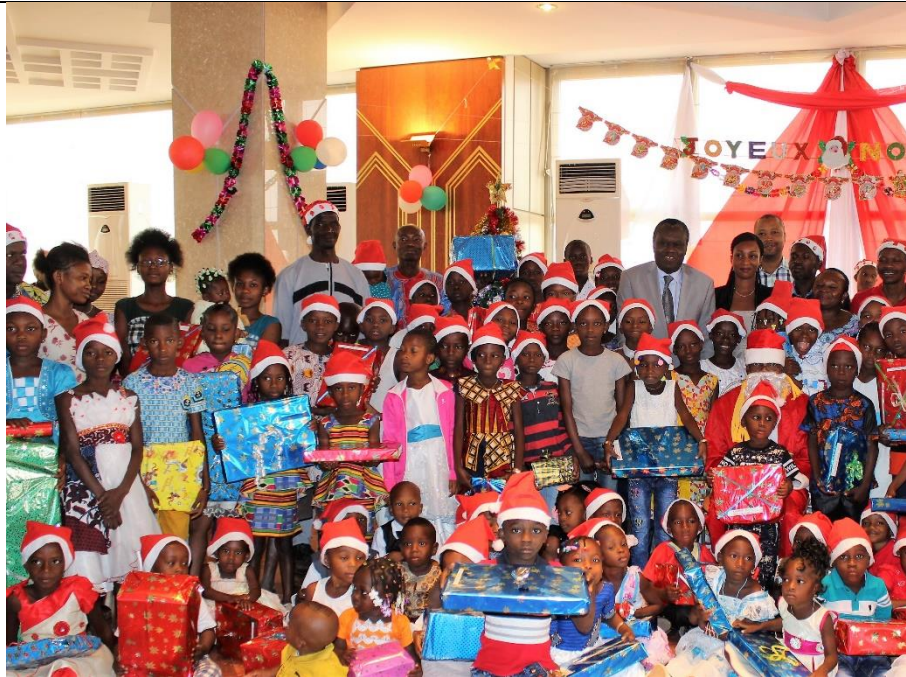
Les enfants des agents de la Fondation FHB autour de leur parrain