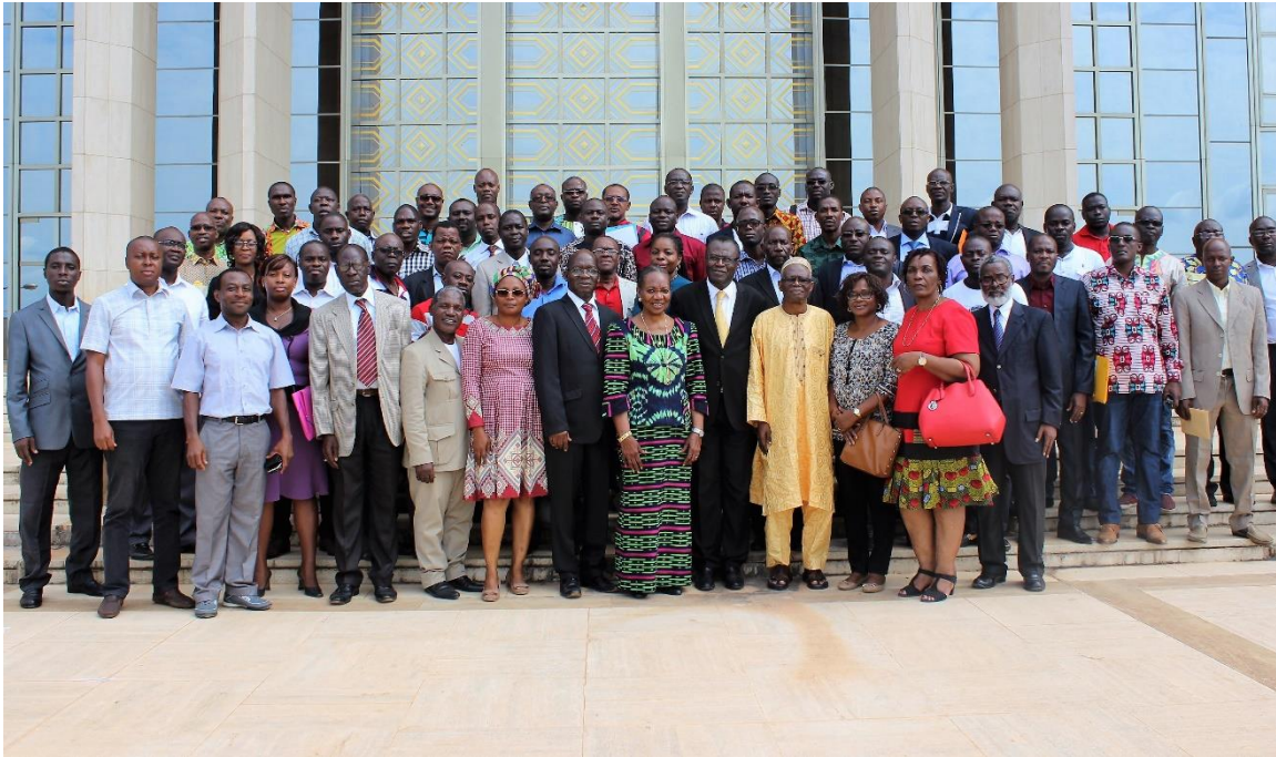
La photo de famille