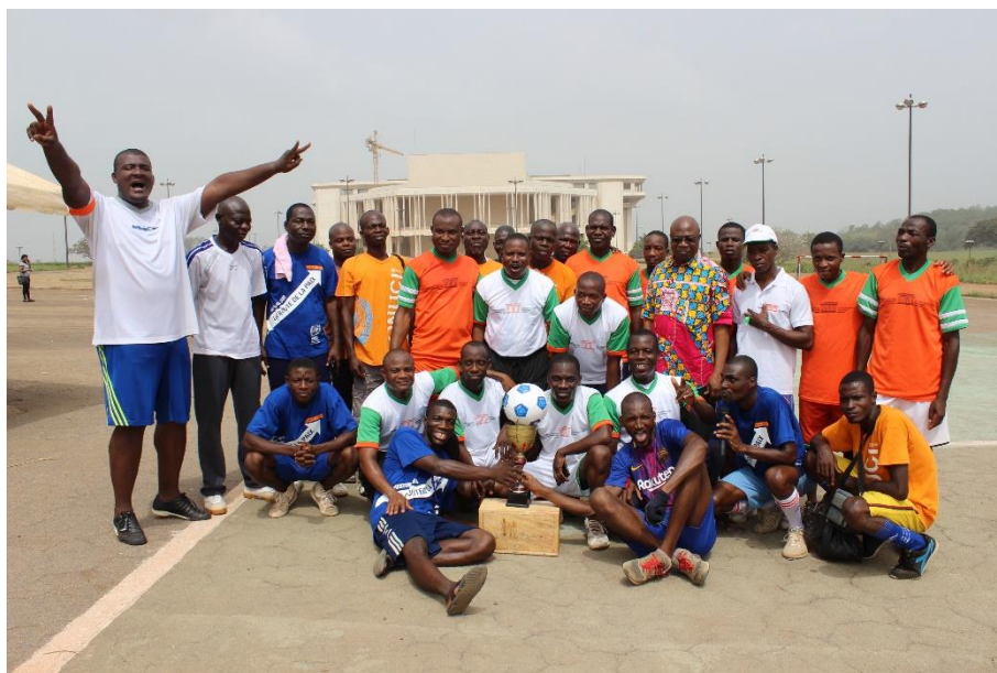
Photo de Famille des participants au Tournoi de la Fraternité 2017