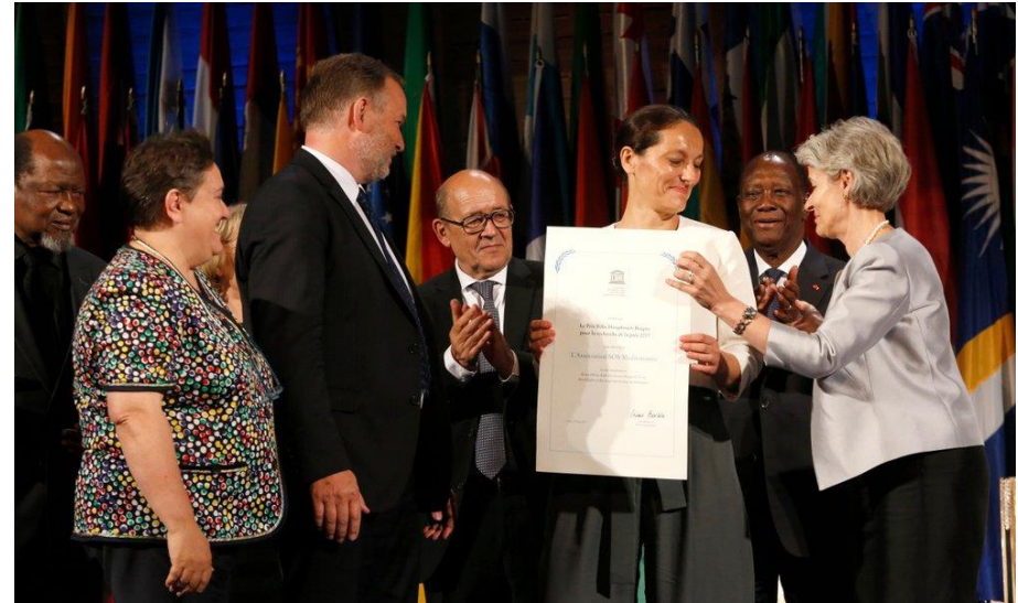
Les co-fondateurs de SOS Méditerranée recevant leur récompense