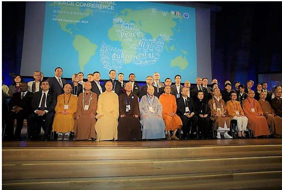
La photo de famille