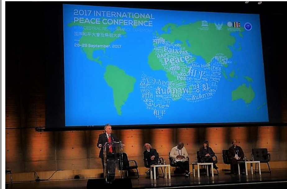
Des participants à la conférence au cours d'une communication