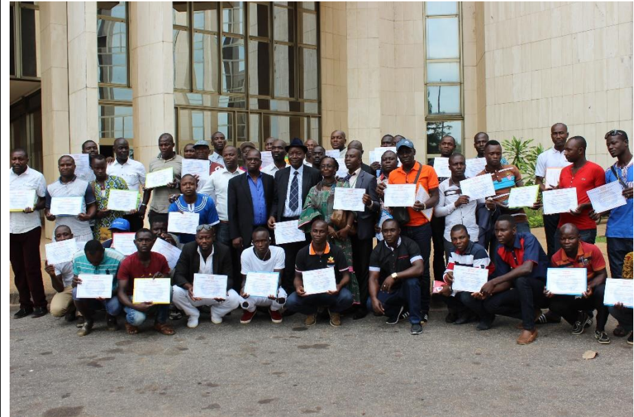
La photo de famille