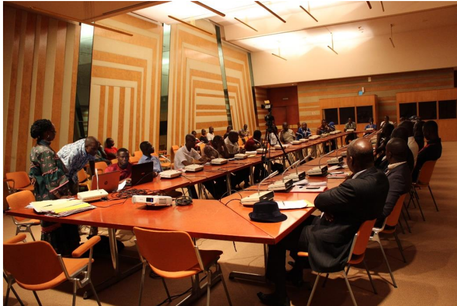
Une vue de la salle de séminaire

les 29 et 30 novembre 2017 à Yamoussoukro