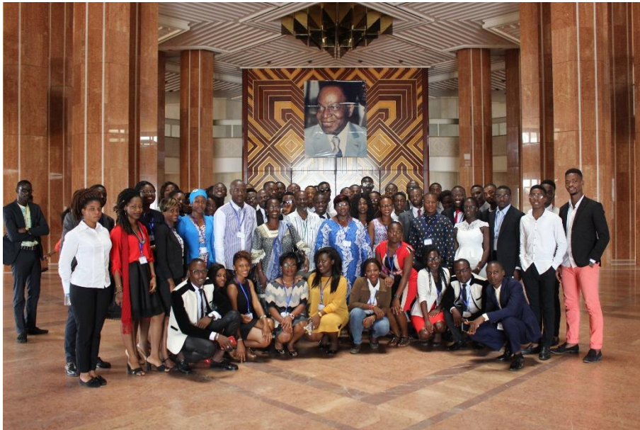
La photo de famille dans le hall principal