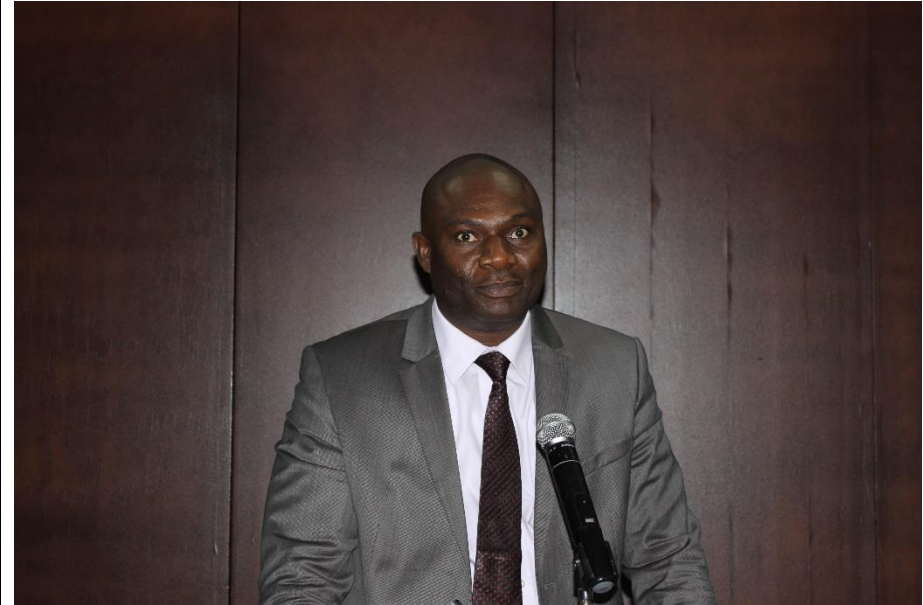
Pr Sébastien Lath Yédoh lors de la Conférence publique