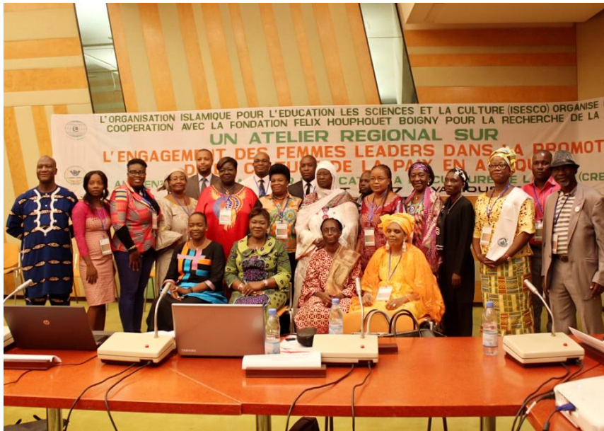
La photo de famille