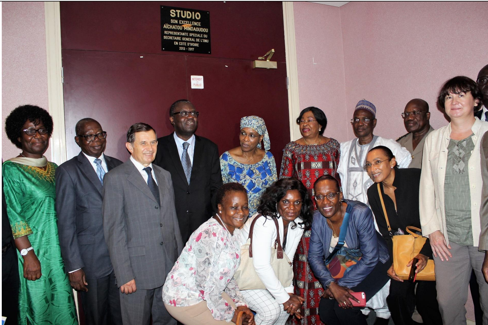
La photo de famille à l'entrée du studio « Aïchatou Mindaoudou »