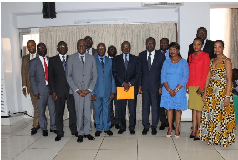
La photo de famille