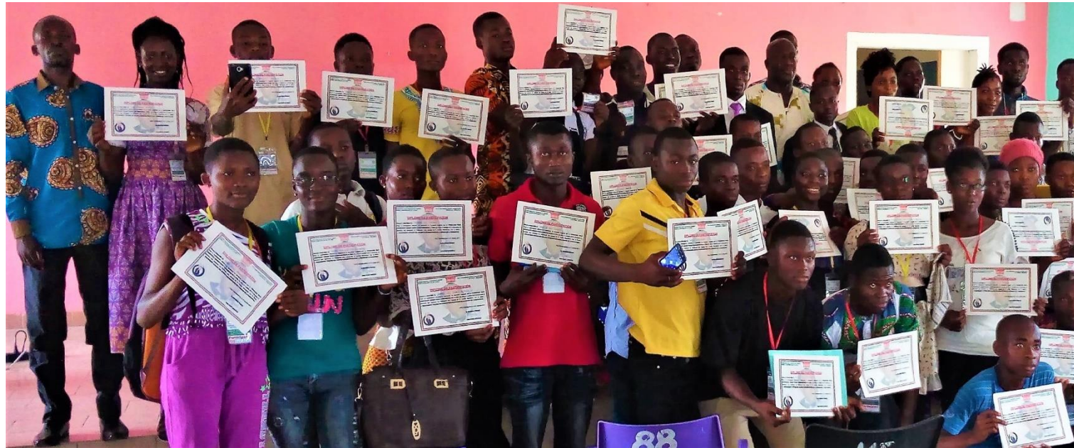
La photo de famille à la remise des diplômes de participation