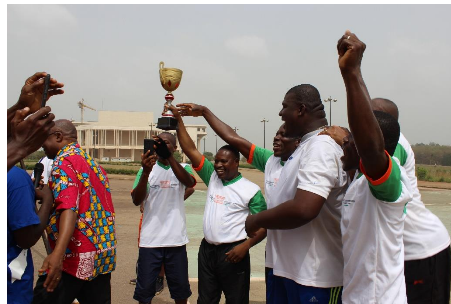
L'équipe victorieuse du Tournoi de la Fraternité brandissant son trophée