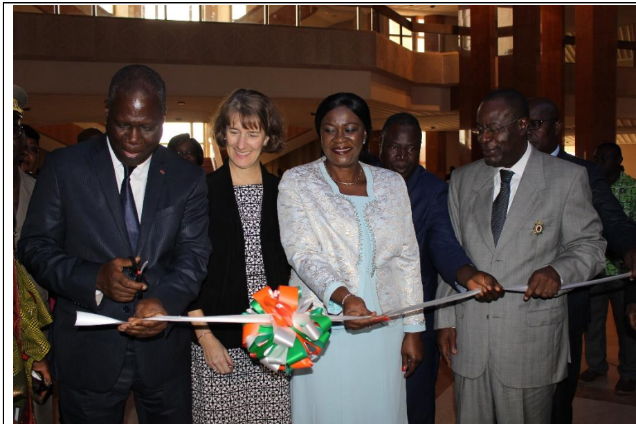
La coupure du ruban inaugurant la Librairie de la Fondation FHB par le Ministre Maurice Bandaman (à gauche) assisté de personnalités