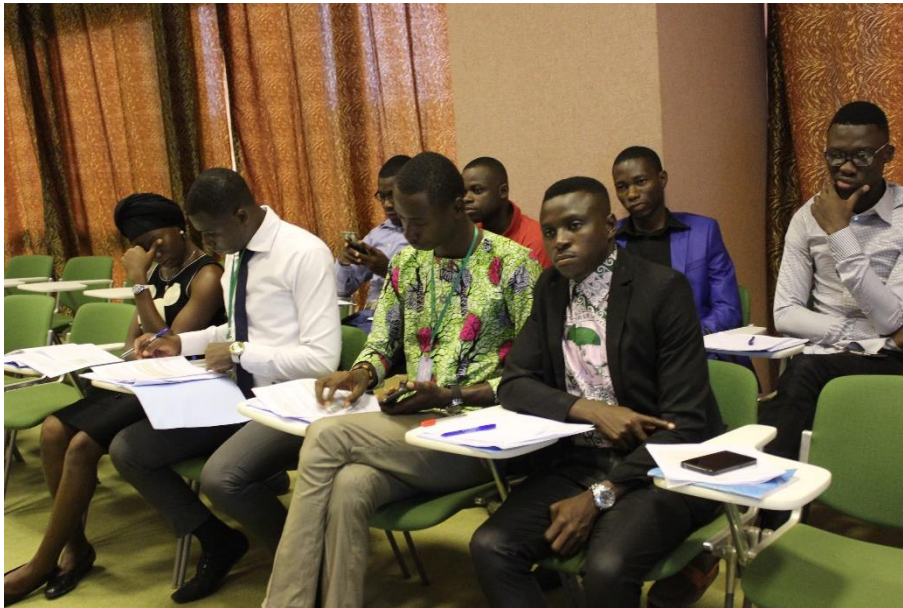
Des participants en atelier