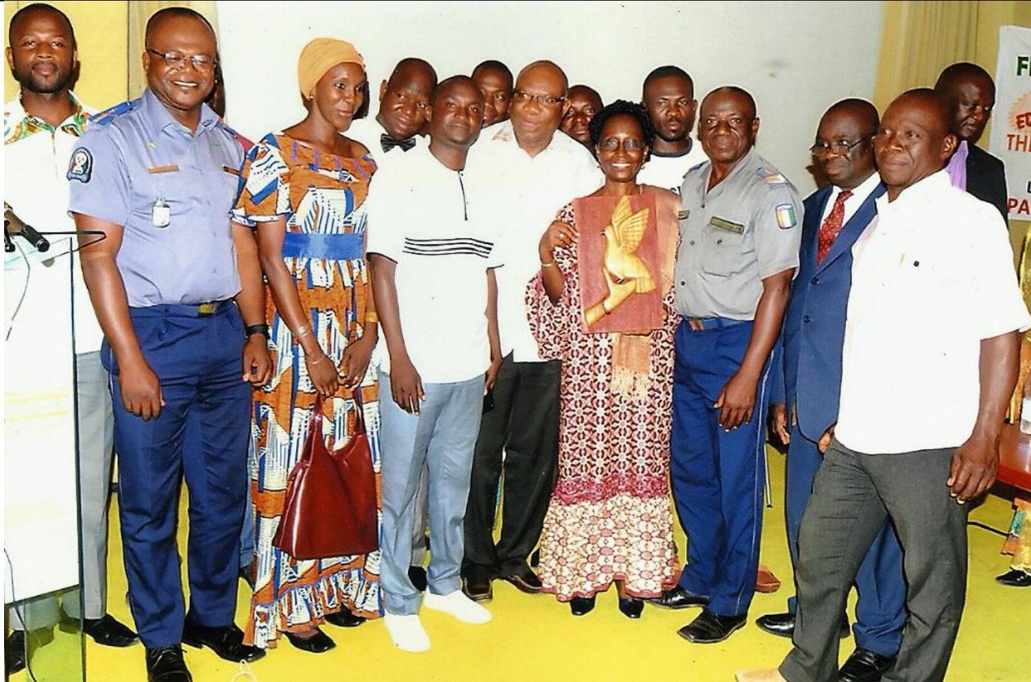
La photo de famille