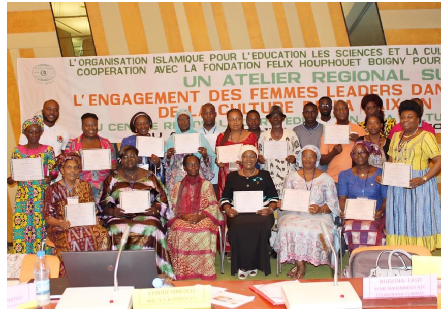
La remise des diplômes